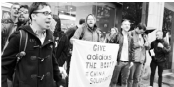
Concentració en solidaritat amb les treballadores xineses en vaga.

Vam entrevistar 13 persones treballadores de Lide (10 dones i 3 homes). No se'ls va informar de manera oficial, sinó que la notícia els va arribar per un filtració. Les persones treballadores van reaccionar amb una vaga des de desembre de 2014 fins a abril de 2015, exigint una indemnització raonable. La vaga, que va comptar amb una àmplia cobertura mediàtica, es va considerar un èxit. Lide