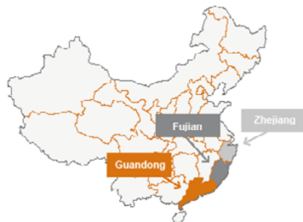
Figura 2 Les principals províncies productores de calçat a la Xina

ta cada vegada més gent gran perquè a les fàbriques els costa captar treballadores joves. Per exemple, vam parlar amb vuit persones que, quan van ser entrevistades, només portaven treballant a fàbriques de Yue Yuen alguns mesos. Set d'aquestes persones tenien entre 40 i 50 anys. L'edat mitjana de les plantilles, per tant, sembla que està augmentant. Això podria explicar perquè l'acció sindical tendeix a centrar-se en la seguretat social i, en concret, en les pensions.