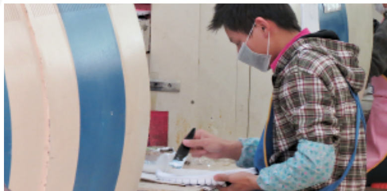
Els problemes de salut de les persones que treballen en la producció de calçat estan sovint relacionats amb la manipulació de productes químics tòxics sense la protecció adequada.

va accedir a indemnitzar, però va intentar pagar el mínim possible. En un principi l'empresa va insistir a pagar 68 euros per any treballat, però només fins a un màxim de cinc anys. Van haver de convocar una altra vaga perquè Lide es comprometés a pagar fins a sis anys treballats amb una quota basada en el salari mitjà mensual. La companyia no va acceptar totes les demandes però els treballadors i les treballadores es van sentir satisfetes amb els resultats de la negociació de manera unànime. Per això, la vaga del personal de Lide es considera un bon exemple d'una protesta exitosa de la societat civil, emparada per la legislació laboral. El cas de Lide també és un clar exemple de com les empreses tracten de fer servir la reubicació i el tancament de fàbriques per evitar complir amb les seves responsabilitats de cara a les plantilles. Aquests han de fer servir tots els mitjans al seu abast per defensar els seus drets: tant les vies legals com ara les vagues.