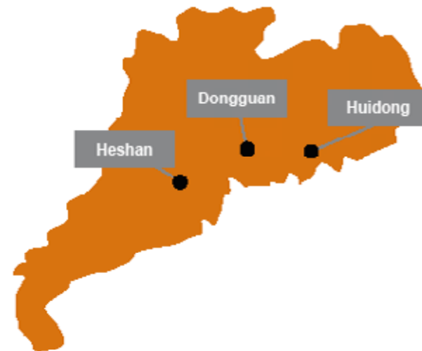
Figura 3 Les principals regions productores de calçat a la província de Guangdong

Treball forçós: Vint-i-cinc de les persones enquestades (el 53%) van dir que havien estat forçades a fer hores extra. Negar-se a fer aquestes hores suposa càstigs com ara amenaces d'amonestacions, reducció de prestacions, descensos i abusos verbals. Moltes d'elles deien que depenien tant de la paga per fer hores extra que la consideraven una part important del seu salari habitual. Per aquesta raó, moltes persones no se sentien obligades a fer hores extres, fins i tot quan aquestes superaven les 30h al mes.